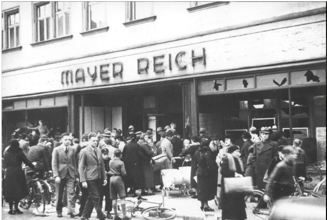
Stadtarchiv Dessau-Roßlau Signatur: FI 86c-0001, Bildautor: Otto Leyse

Esta fotografía , tomada en Dessau, Alemania, muestra personas que saquean una tienda judía el día después de la Kristallnacht (10 de noviembre de 1938), el ataque a nivel nacional de sinagogas, hogares y tiendas de alemanes judíos. Como se ve en esta foto, las mujeres llevaban cochecitos para llevar objetos robados. En la Kristallnacht , alrededor de 30,000 hombres y niños judíos fueron arrestados y enviados a campos de concentración.