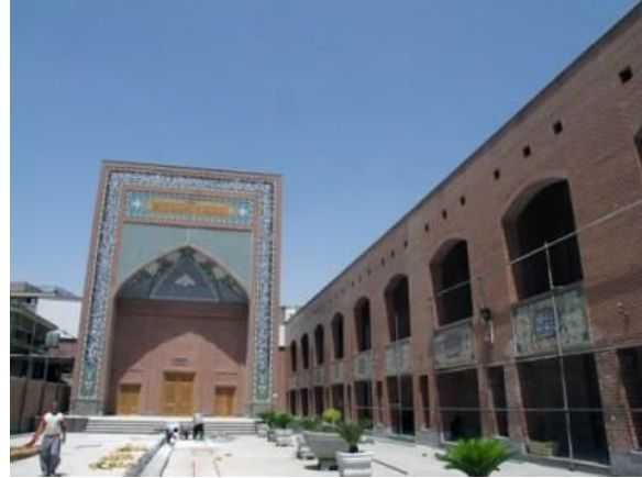
موسسه‌ی فرهنگی شهدای انقلاب اسلامی (سرچشمه)

نمایشگاه‌های دوسالانه‌ی کاریکاتور که قرار است دوره‌ی جدید آن به موضوع هولوکاست اختصاص یابد اصولاً یک نمایشگاه دولتی است و هزینه‌های آن از سوی وزارت ارشاد تأمین می‌شود. اصولاً در ایران هیچ مسابقه و نمایشگاهی بدون مجوز وزارت ارشاد قابل برگزار شدن نیست. برگزارکنندگان این مسابقات و نمایشگاه‌ها آن قدر قدرتمند هستند که وزارت ارشاد نمی‌تواند از دادن مجوز به آنها خودداری کند. محل برگزاری نمایشگاه دوم موزه‌ی فلسطین خواهد بود. موزه‌ی فلسطین هم مانند مرکز صبا بخشی از فرهنگستان هنر جمهوری اسلامی است .