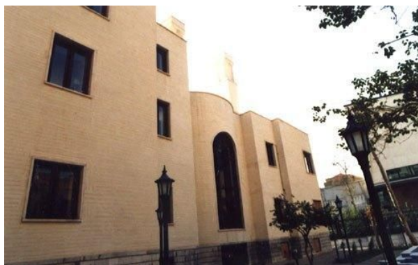
موسسه‌ی فرهنگی هنری صبا

مرکز فرهنگی و هنری صبا که محل نمایشگاه دور اول مسابقه‌ی هولوکاست بود وابسته به فرهنگستان هنر جمهوری اسلامی است که یک موسسه‌ی کاملاً دولتی است و بودجه‌ی آن توسط دولت تامین می‌شود و اعضای آن نیز منصوب مقامات عالی رتبه‌ی نظام هستند.